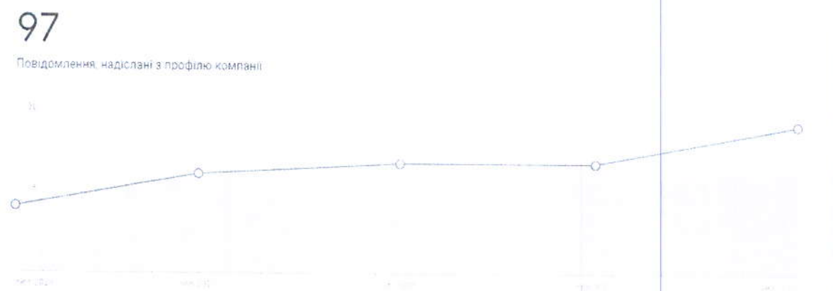
Малюнок 1. Кількість повідомлень в сервісах Google

Протягом I півріччя 2021 року за допомогою « Google Мій бізнес » було надано 97 відповідей на запитання щодо надання адміністративних послуг.