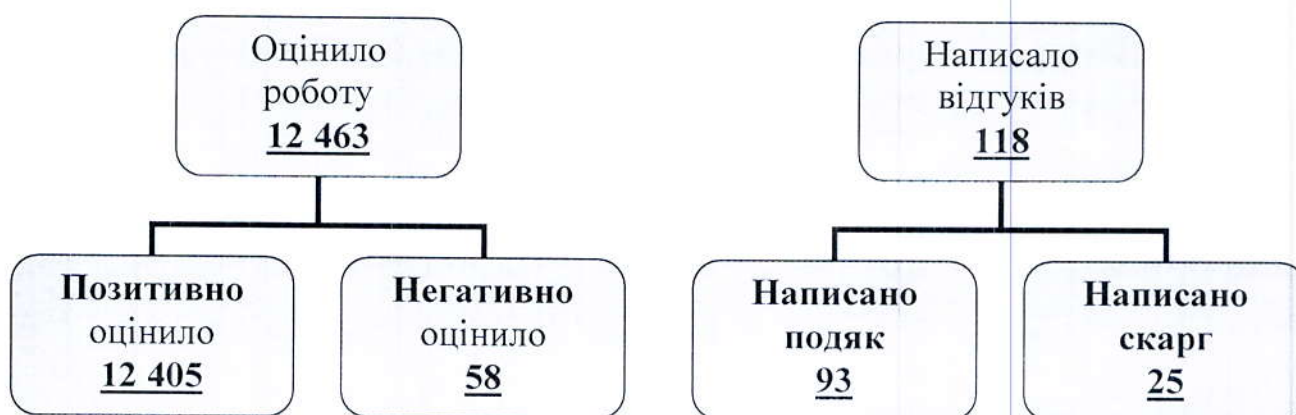
Діаграма 2. Моніторинг якості надання адміністративних послуг за I півріччя 2021 року

ЦНАП м. Івано-Франківська проводить щомісячний моніторинг якості надання адміністративних послуг . Відвідувачі ЦНАП після обслуговування за допомогою талону електронної черги вкидають його у дві ємності «Задоволені якістю обслуговування» та «Не задоволені якістю обслуговування». Детальний моніторинг якості надання адміністративних послуг за I півріччя 2021 року на Діаграмі 1.