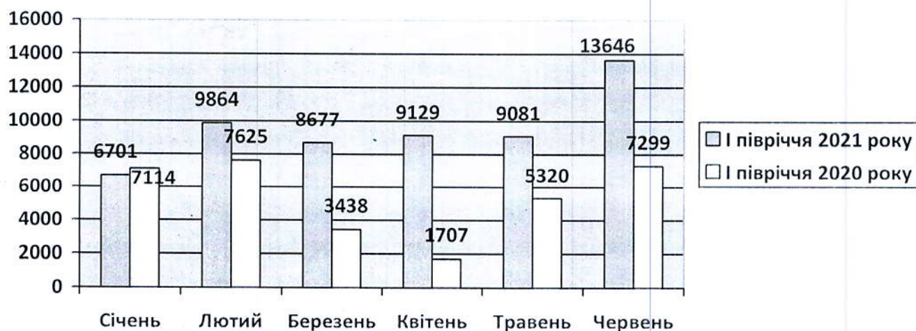
Діаграма 1. Прийняті документи в розрізі місяців

За звітний період Департаментом освіти і науки зареєстровано та перереєстровано 2 128 дітей в ДНЗ міста Івано-Франківська.